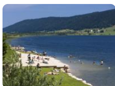
A voir, à faire

La Station des Rousses est composée de 4 villages, Les Rousses, Lamoura, Prémanon et Bois d'Amont. Située à une altitude idéale pour profiter de la nature et de la beauté des lacs et frontalière de la Suisse, cette station est avant tout un espace de loisirs incomparable tant par la qualité de ses paysages que par la richesse des activités proposées.