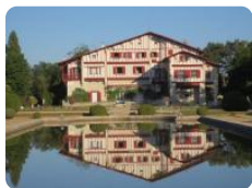
A voir, à faire

Située à mi-chemin entre l'Océan et les Pyrénées, Cambo-les-Bains est une destination de vacances choisie pour rayonner en Pays basque. A la fois village basque pittoresque et élégante ville d'eaux au charme raffiné, elle est marquée par le passage du poète Edmond Rostand qui y vécut dans sa superbe villa Arnaga, aujourd'hui classée Monument Historique, Musée de France et Maison des illustres.