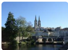
A voir, à faire

Connue pour être la capitale des mutuelles d'assurances, Niort est aussi une ville possédant un charme certain, ainsi qu'un riche patrimoine architectural et culturel.